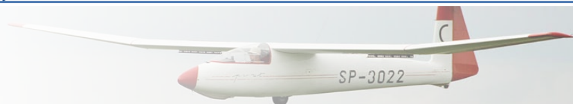
TABELA WSPÓŁCZYNNIKÓW - KLASA KLUB